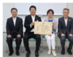
▲第7回まちづくり法人 国土交通大臣表彰